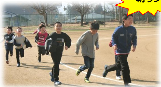
朝ボラ前の一走り、ここでもお手本示すよ!