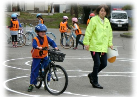
交通教室での8の字走行テスト

7才児の交通事故が一番多く、とび抜けていることは何度かお話してきました。これは、今まで大人がついて手をつないで歩いていたものが、一人で歩くことを経験し、少し自信をつけて、放課後、家に帰ってからの外遊びが多くなるからです。原因第1位は圧倒的に「道路への飛び出し」です。また、自転車に乗り始める3年生もとても心配です。交通教室では、上級生に比べて見ると、一本橋や8の字走行テストで、やはり一番ふらつきが見られました。帰宅後の生活について、しっかりとご家庭でお話し合いいただき約束づくりをよろしくお願いいたします。