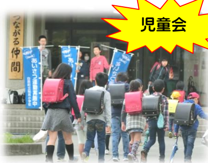
あいさつ運動で学校を明るく!