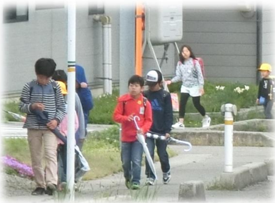
元気に登校し、明るくあいさつする子ども達