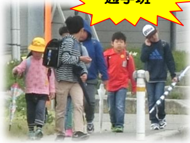
下級生を心配して振り返る班長

本校の伝統、たくさんある中で何気ない小さな事の積み重ねだけでも、もの凄く大きな流れをつくっているものがあります。それは最上級生の頑張りです。下級生の面倒を見ることやお手本となることは、当たり前のことかも知れませんが、実はそう簡単なことではありません。昨日今日、急にできることではないのです。1年生の頃から先輩にお世話になり、親しくなってその姿にあこがれを持ち、「やがては自分も！」と決意して努力を積み重ねてきたのです。鮎貝小の6年生の姿は本校の誇りであり宝です。